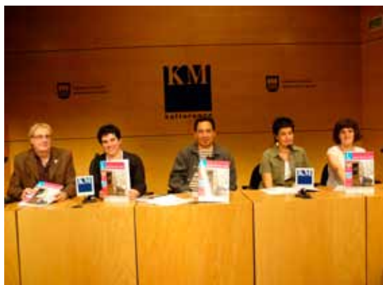
Bergarako Idazle Eskolako kideak Donostiako K. Mixelena Kulturunean euren literatur aldizkaria aurkezten