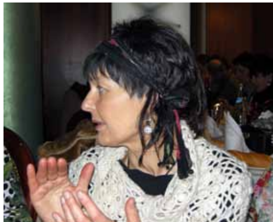
Karmele 2000ko hamarkadan