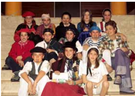
Kultur Astea eskolan