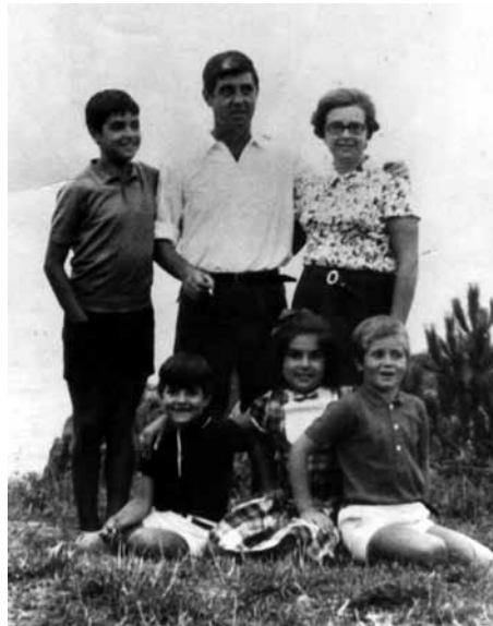
Aita-amak eta lau neba-arrebak