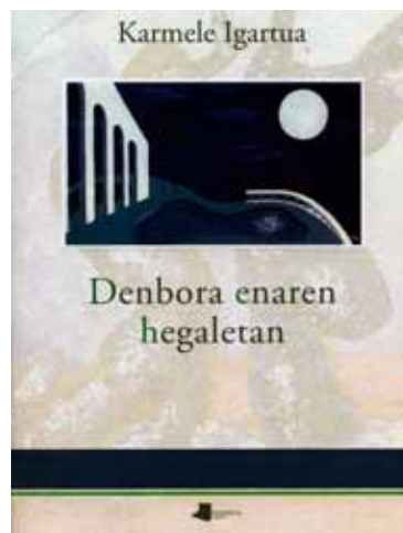
Denbora enaren hegaletan poesia-liburua, 2009

baitira mintzagai, bertan galderak ondo hautatzea eta ondo egitea bilakatzen baita pentsamenduaren eta edertasunaren muin. Galdera-erantzun binomioa atzekoz aurrera jartzeko intuizioak eta kemenak goren gradura igotzen dute poesiaren egitekoa, izan ere, ez baitira poemak galdera bati erantzuten diotenak, baizik eta poemetan agertzen diren egoerak eta argibideak galderak sortarazten dizkigutenak.