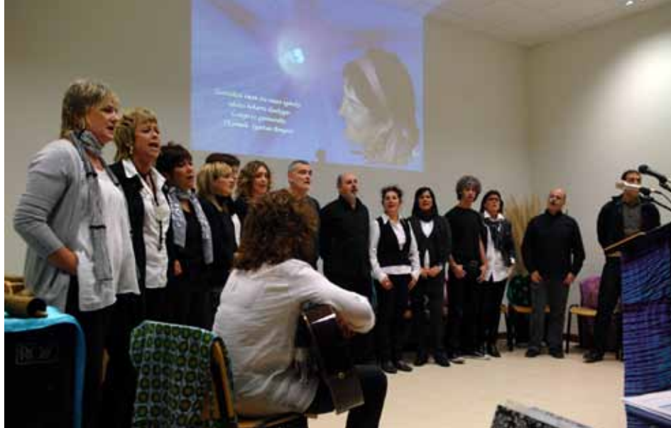
K. Igartuari Bergarako Idazle Eskolan egin zitzaion omenaldikoa, 2010eko azaroan