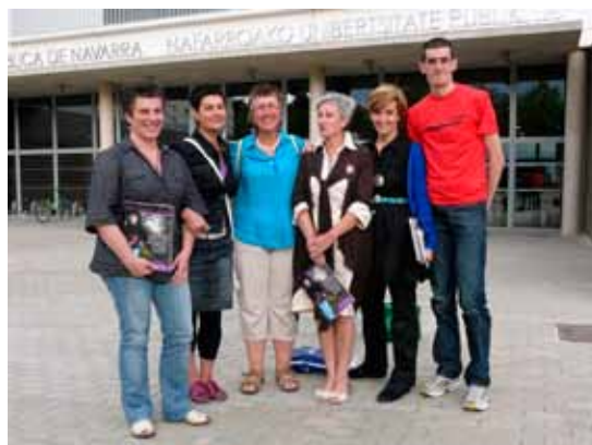
Euskal Idazle Eskolako kideak Tuteran, Nafarroako Unibertsitate Publikoan egindako ekitaldi batean, 2009

Eta definizio horiek txinparta baten gisara agertzen dira orrian, jarraiko irakurgarrita- sunari begiradaren baterakotasuna atxikiz. Hizkuntzaren linealtasuna eta irudiaren bateratasuna, instantearen atxikiezina eta txinpartaren indarra ematen ditu liburu honetan agertzen den hiztegiak: hustu, isla, pirata, aparra, arraina, lur-muturra, marka, itsas argia moduko hitz konkretuak dira batzuetan, eta beste batzuetan, metafora, iruditu, garen-garena, neu, dena, bat... be- zain hitz etereoak, ez huts ez hutsal.