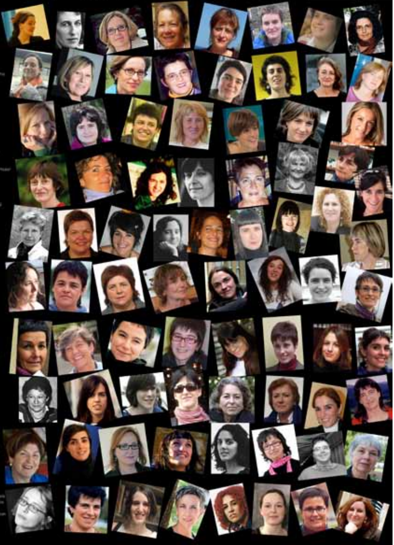
Euskal emakume idazleak. Euskal PEN Klubaren posterra, 2011