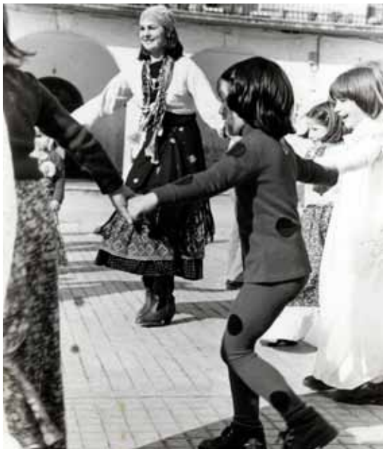
Andereño Aretxabaletan. Inauterietan haurrekin dantzan