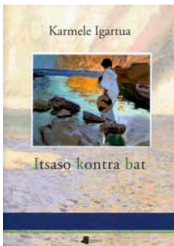
Itsaso kontra bat liburuaren azala, 2011

amaiera kontzeptuek, eta jakintza, pentsamendu eta bizipenei buruzkoek hartzen dute erdigunea. Oraingoan, hori bai, eguneroko zirkunstantzia eta baldintzak argiago agertzen dira, askotan.