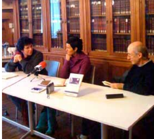
Denbora enaren hegaletan liburuaren aurkezpenean, 2009