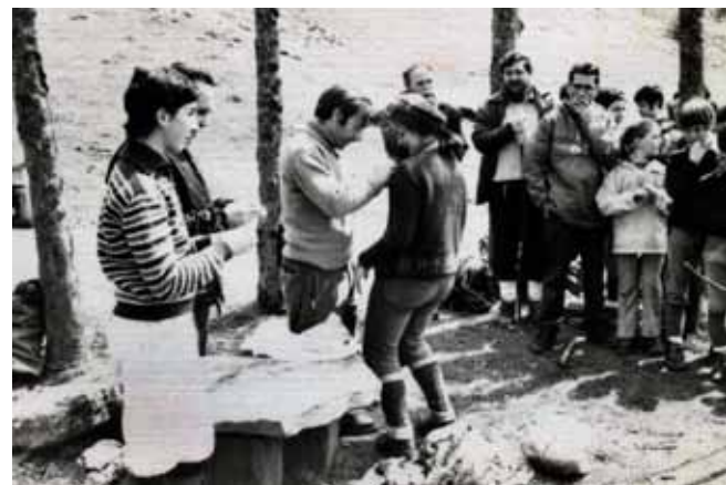
Mendizalea izan zen eta familia-giroan bizi izan zuen eskual mendiak eta basoak ezagutzeko pasioa. 1973ko argazkia