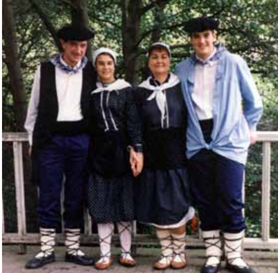
Familia osoa Aretxabaletan, 2000. urteko San Migeletan

Amatasunak bezala alaba izateak eragin ezinbestekoa izan dute Karmele Igartuaren baitan, hala pentsaeran nola jokaeran, hala literatur sorkuntzan, pedagogian pentsatzean nola bere seme-alabentzat eta seme-alabekin sortu nahi zuen mundualdian. Honetan ere, denean behar zuen zer eta zer horren zertarakoa eta nolakoa galderei erantzun beharra bizi-bizi zuen.