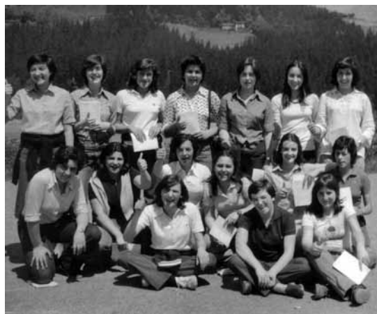
Eskoriatzako Almen ikastetxeko lagunekin batxilergoa egiten ari zirela, 1976

Ikasteaz batera, Alecop estudianteentzako kooperatiban egiten zuen lan, orduko hainbat langileren seme-alabek bezala. Lehen ere, Batxilergoan eta udan lan egin ohi zuen, adibidez, Aretxabaletako Copreci industria-kooperatiban telefonista moduan.