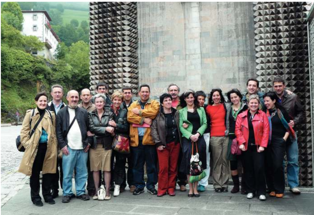
Arantzazu. Idazle Eskolako ikasleekin. 2006-2007 ikasturte amaierako ikasle eta irakasle batzuekin

XXI. mendera iritsi gara eta Tsvietaievaren lanak eta berari buruzko iritziak ugaritzen- ugaritzen ari dira. Idazle ezagun xamar izatera ere iritsia da. Aldaketa honen arrazoi nagusietako bat, nire iritzian, beste egile askotan gertatzen den bezala, bere bakantasunean datza. Hainbat sortzailek egiten duten lana hain da senetikoa eta errotikoa, ezen aurretik uste duguna ahaztea jakintza bidea izan daitekeela ondorioztatzeko denbora-tarte bat behar den.