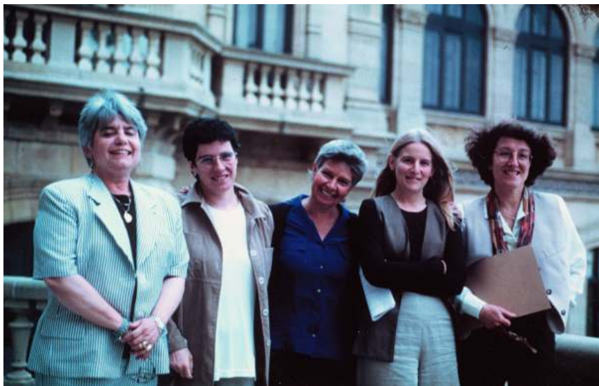
Generoari eta Ekintza Postiboko Politikei buruzko Nazioarteko II. Batzarra. "Adanen emazteak" irakurketan

Noski Freinet, Freireren bidez izango zen, baina guretzat euskal andereñoen irakaskuntzak irauli zuen mundu ikuskera hura, eta ez don eta doña esanez izendatu behar ziren irakasle haiek, OHO-arekin berrituak izan arren.