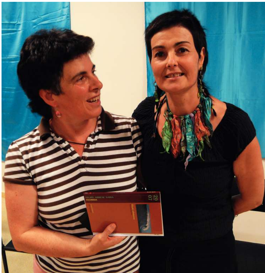
Karmelegartuaren Hitzak orbainetan liburuko aurkezpena

Venus bere garaia birsortzen da, heltzen da, iristen da, eta bere begiradarekin ikuslearen begirada harrapatu nahi du. Bere begiradarekin irten bezala egiten da koadrotik. Bere garaia ez da iada iragan garaietatik zuzenean datorrena, eratorria, ez da izandakoaren ondorio huts. Bere garaia ez da aurreikusten eta planifika zitekeen etorkizuna. Ez da lerro zuzen bateko puntua. Etena da: erabakia, euskarazko erabaki zentzuaren adiera oinarrizkoenean: era-baki “ebaki arazia” baita edota “ebaki arazlea”. Venusen garaia, beraz, ez da iragana eta ez da etorkizuna, bere garaia da gure garaia: begira harrapatzen duenarena, beste batekin sortzen den garaia.