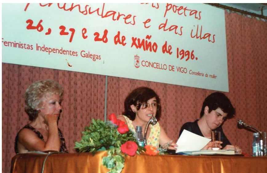
Vigo, 1996. 1º Encontro das Poetas peninsulares e das Illas. Lehen Kongresua

Hala ere, ez nagokie oso adi joerei. Garaikidetzat dut garaian bizitzen eta garaia sortzen laguntzen didana. Garaikidetzat dut, ia beti, askatzaile sentitzen dudana.